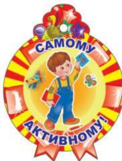
Приложение 3. Медальки выпускникам объединения «Логорадуга» после прохождения программы за 2 года.