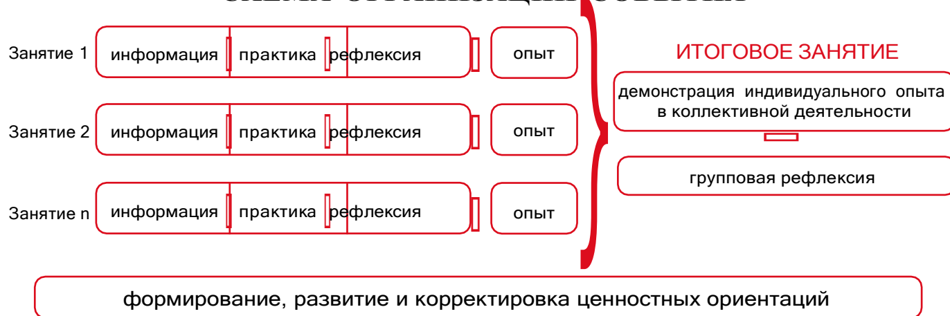
Рисунок 1 — Схема организации события

Таким образом, у пятиклассников происходит построение логической цепочки от собственного опыта проживания каждого занятия к ознакомлению с опытом других детей и к формированию общего отношения классного коллектива к прожитому ими событию.