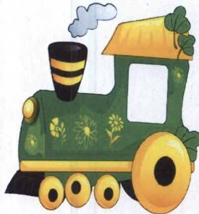
Поезд, Машинист, Вагоны.