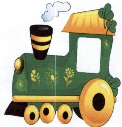
Поезд, Машинист, Вагоны.

3. Они бывают разные – Зеленые и красные. Они по рельсам вдаль бегут, Везде встречают их и ждут.