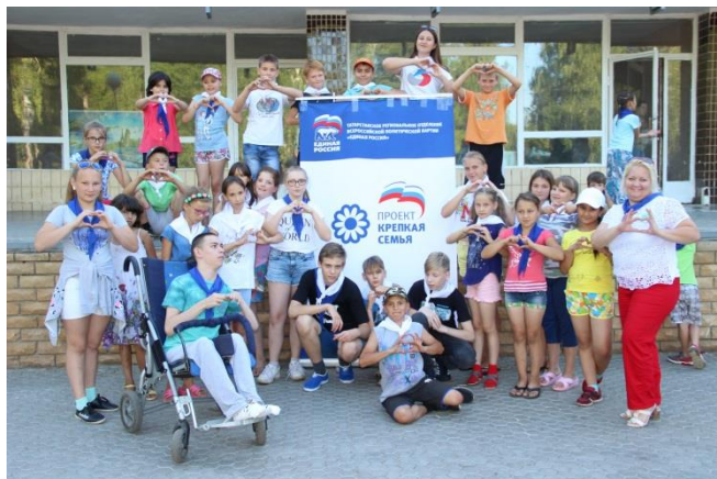
Торжественное открытие детско-родительской смены