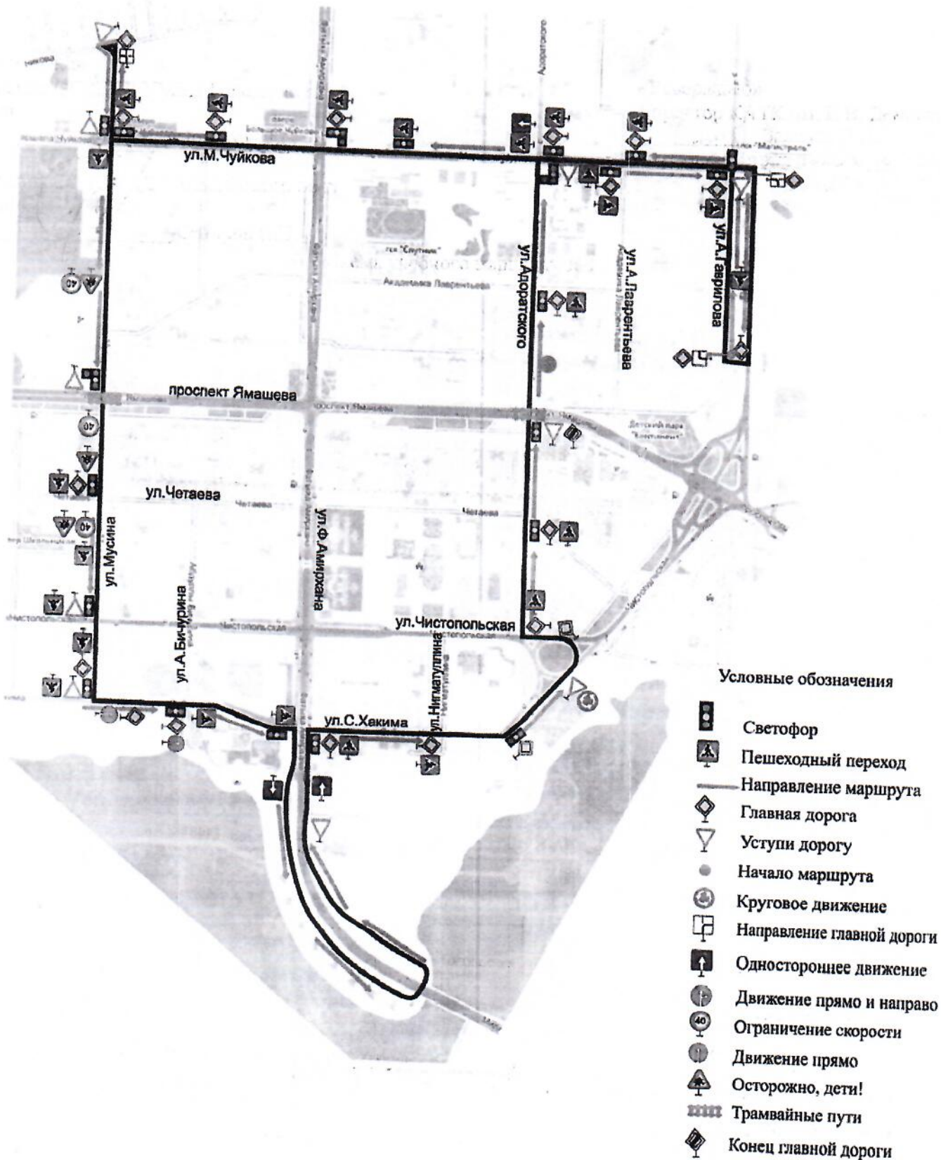
Схема учебного маршрута №1

Период действия с «26» 10 2020 г. до «26» 10 2021 г.