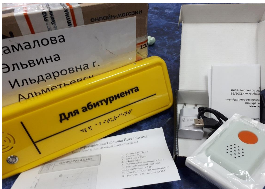
Рис.3. Звуковой-тактильный информатор НОТТ и говорящая информационная табличка НОТТ-Оптима

7. В рамках партнерства с ГАПОУ «Альметьевский политехнический техникум» (соглашение от 09.11.2019), интеграции детей с ОВЗ и инвалидностью приобретено оборудование, предметы длительного пользования: Звуковой-тактильный информатор НОТТ (5 шт.) ( пример на рисунке 3 ) и говорящая информационная табличка НОТТ-Оптима (10 шт.). На информатора и информационную табличку записана краткая навигационная информация для абитуриентов с ограниченными возможностями здоровья.