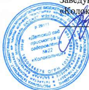
ГРАФИК РАЗДАЧИ ПИЩИ В ГРУППЫ