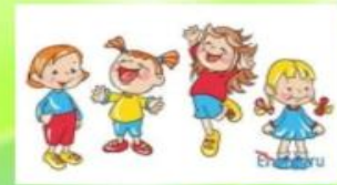
«Очты – очты» уены