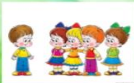
«Көн – төн» уены

Балалар уеннары арасында аеруча гакыл-зиһен эшчәнлегә таләп ителә торганнары бар. Мәсәлән: «Без дә», «Ватык телефон», «Очты – очты», «Ябалак», «Көн – төн» һ.б. бу уеннар беренче чиратта игътибарлылык сорый, логик фикерләүне арттыра. Бу уеннары уртанчы яшьтәге балалар белән дә уйна була, зурлары белән дә. Беренчесендә уеннар гадирәк, сүزلәре азрак була; балалар үскән саен уен катлаулана. Яңа теманы өйрәнгәндә «Ватык телефон» уены аша балаларны яңа сүزلәр белән таныштырырга була; баланың колагына пышылдап кына яңа сүз әйтсәң, ә ул икенчесенә ... һ.б. Бу уен бигрәк тә уртанчыларга ошы. Ә зурлар белән сүз урынына сүзтезмә яки кечкенә жөмлә кулланырга була. Халык юкка гына бу уеннарны зиһен-сынаш уеннары дип атамаган, алар балаларның логик фикерләү сәләтен үстерүчә әһәмиятле чара, халык педагогикасының гүзәл үрнәкләре.