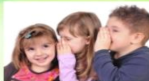
«Ватык телефон» уены