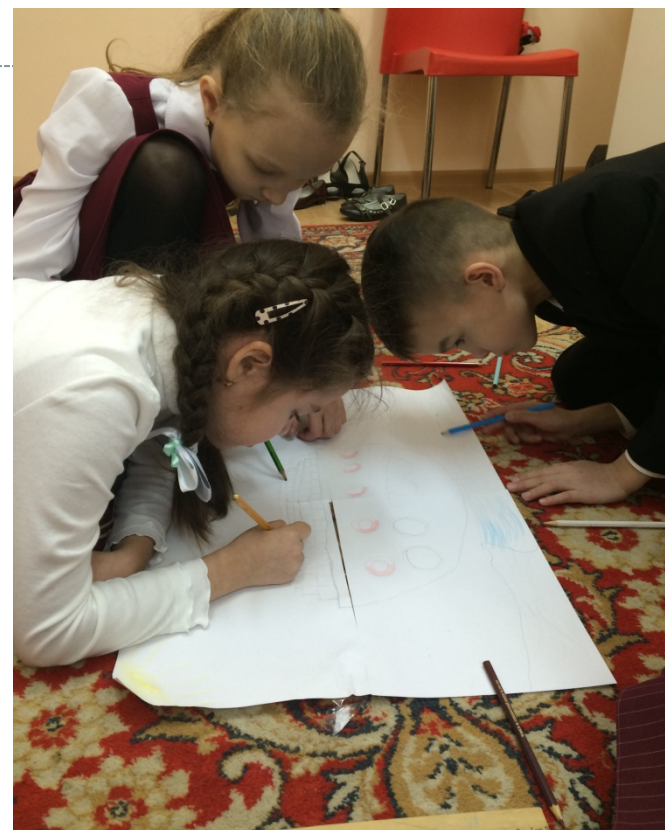
АРТ - терапия