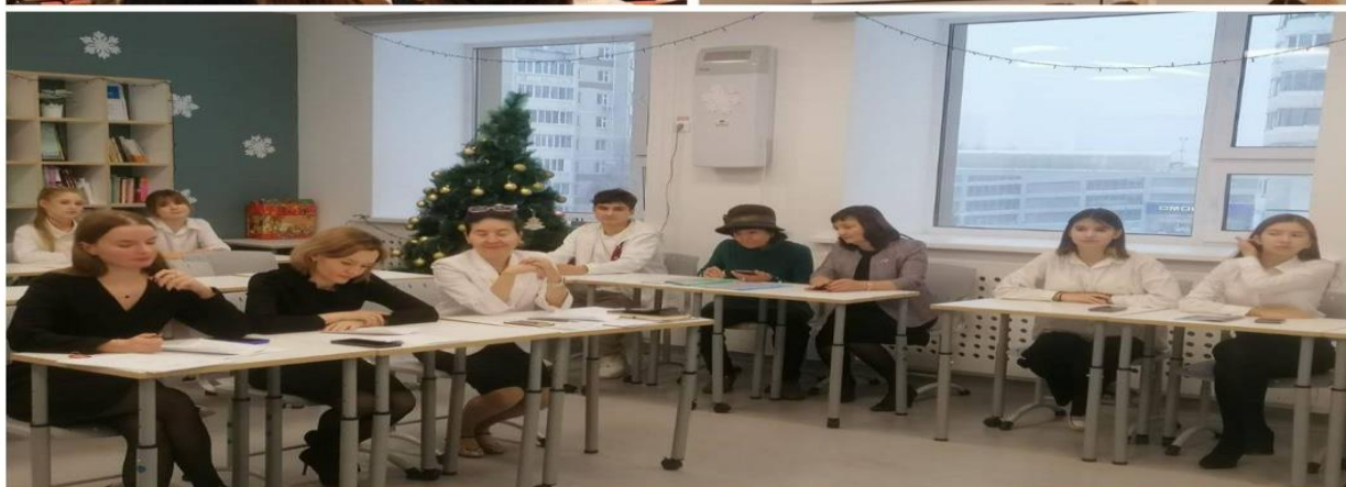
Помощь в проведении городской НПК «Содружество»