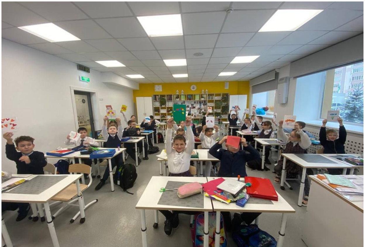
Мастер-класс “Из мусорной кучки разные штучки”