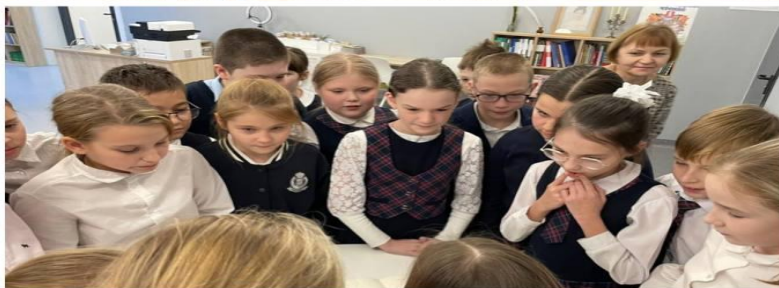
Тематические лекции, посвящённые дню памяти Неизвестного солдата