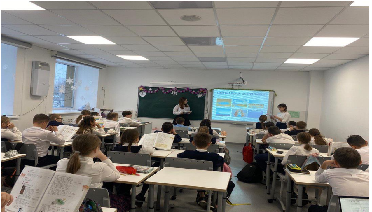
Лекция “Лаборатория чистой воды”