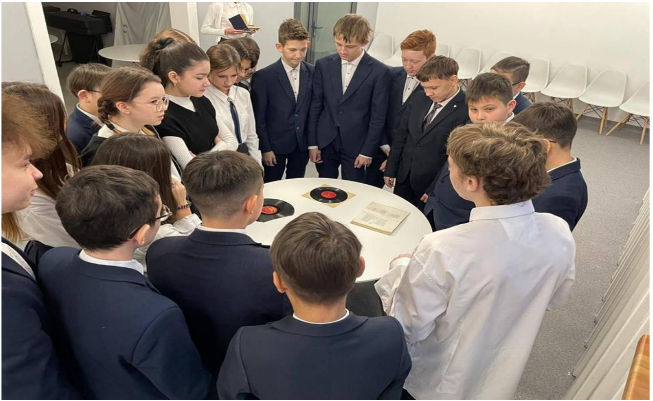
Экскурсия: «День неизвестного солдата»