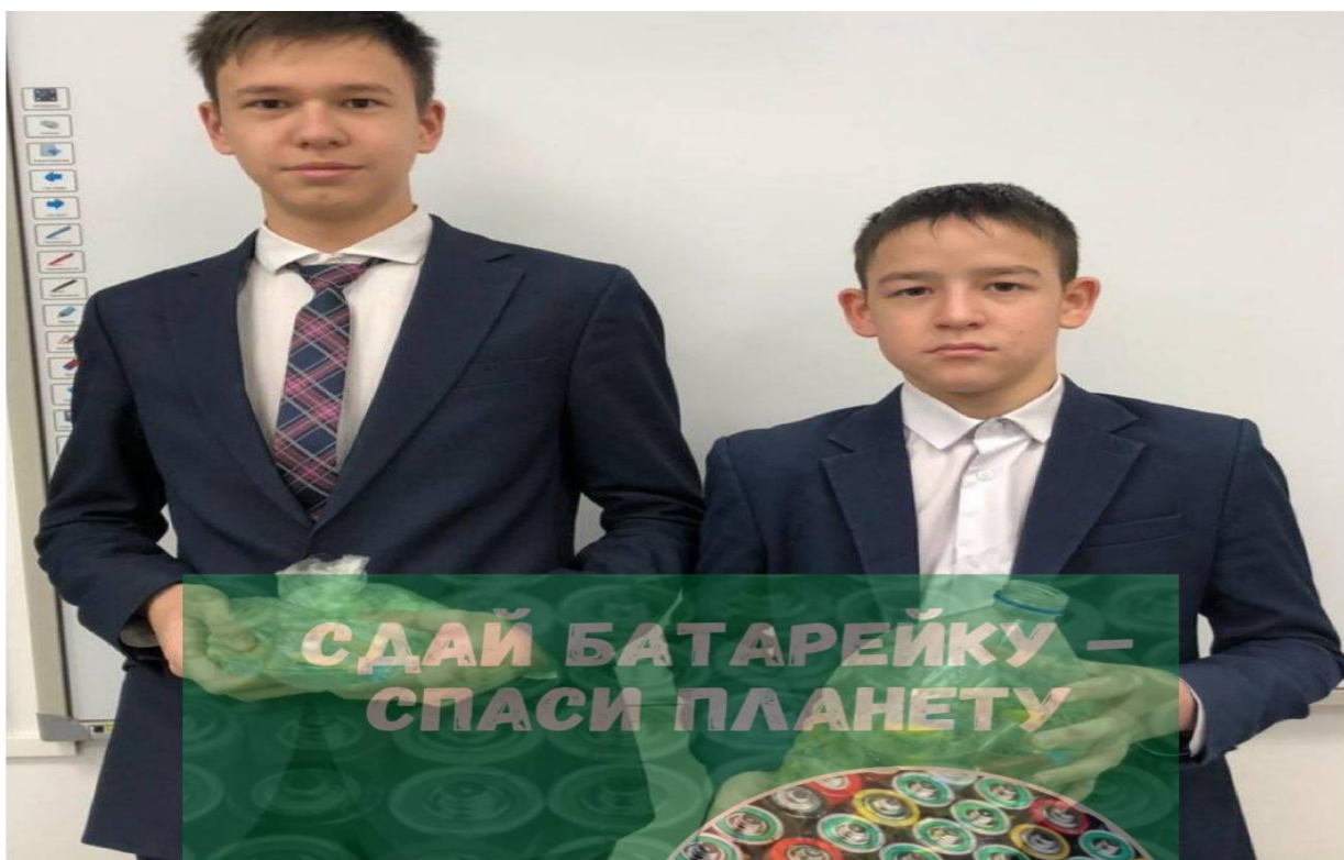
Экологическая акция «Неделя батарейки»