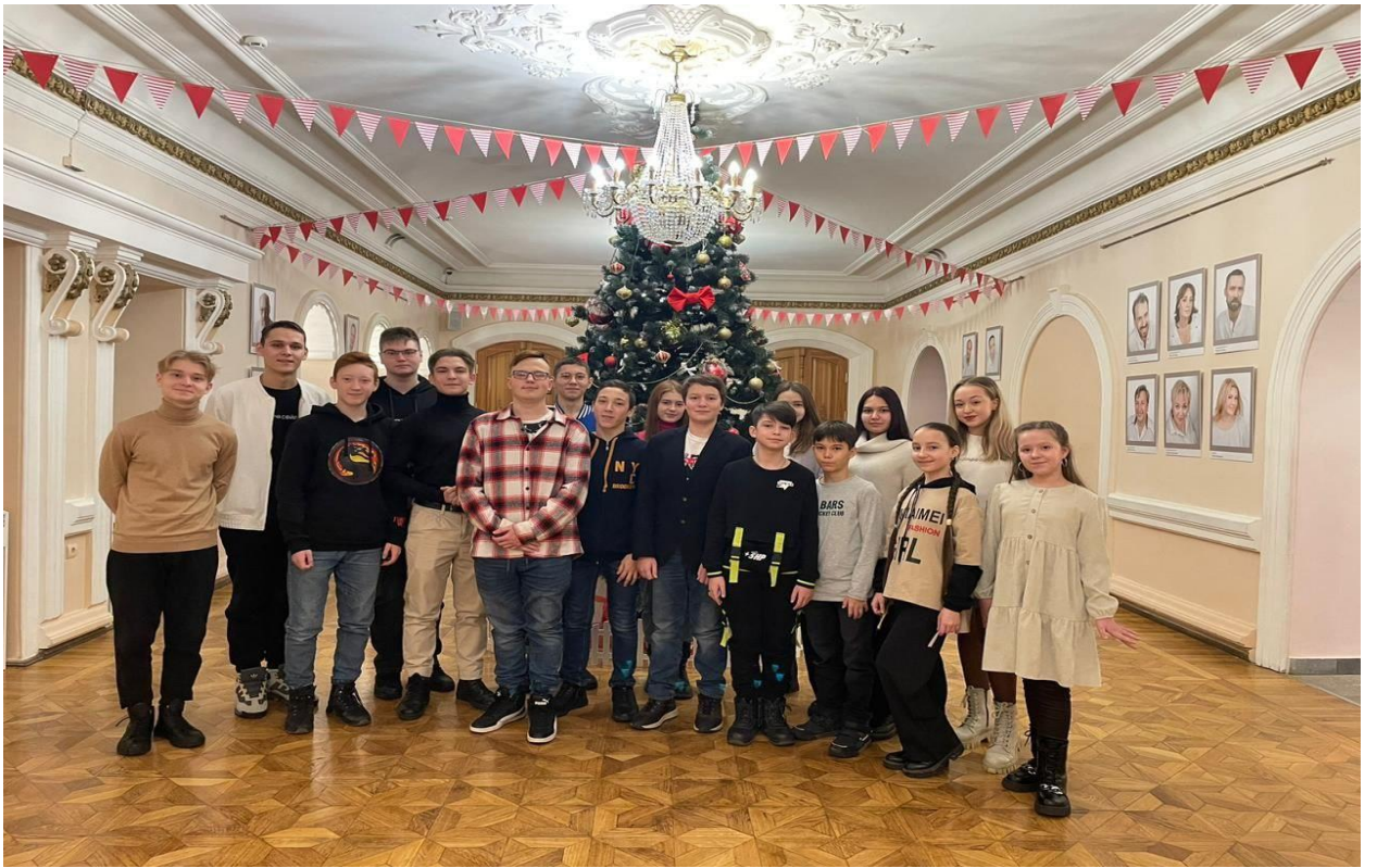
Поход в ТЮЗ