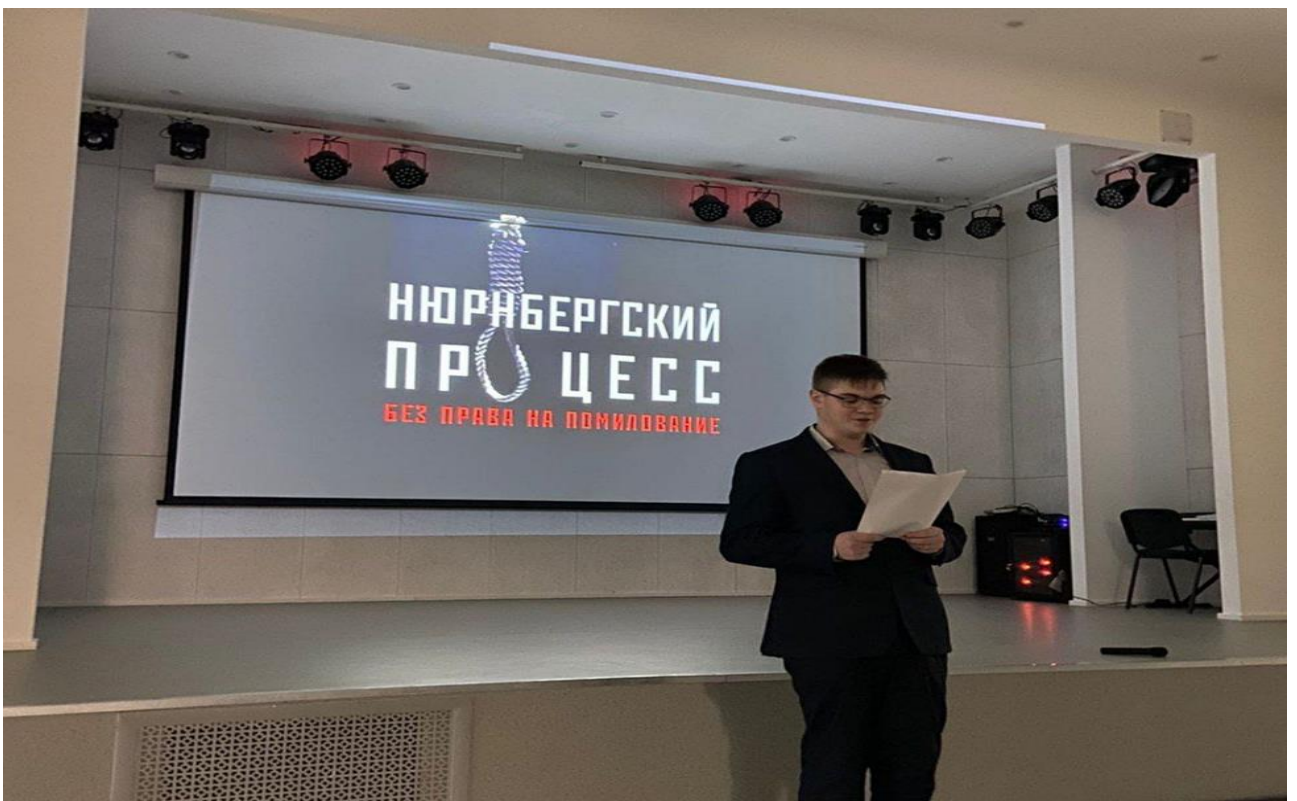
Лекция «Нюрнбергский процесс. Без права на помилование»