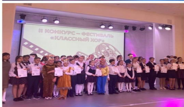
Гала-концерт II-ого конкурса-фестиваля «Классный хор»