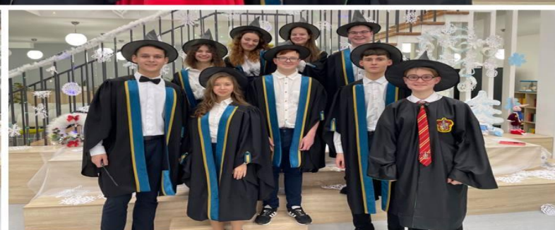
Участие на II гимназическом балу