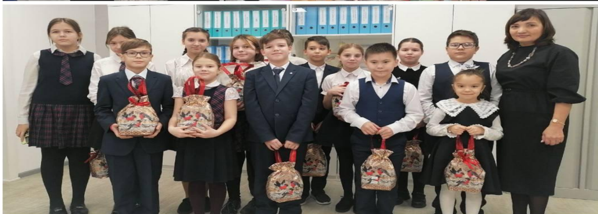
Организация благотворительной ярмарки