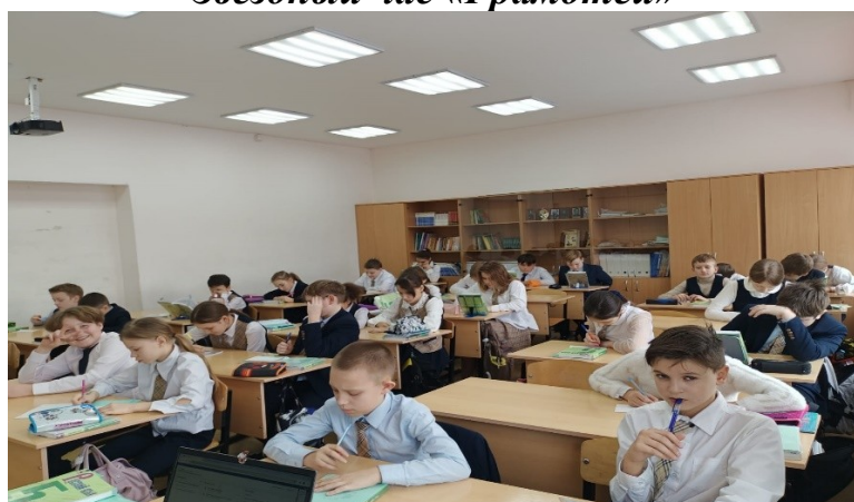
Словарный диктант в 5 В классе