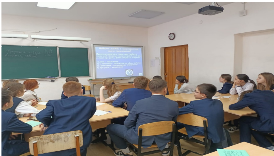
Звёздный час «Грамотей»