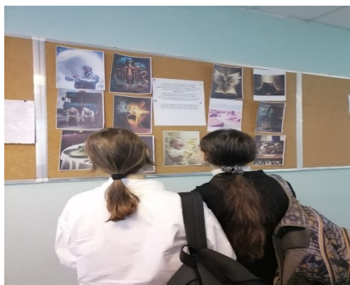
Ученицы 10а класса по картинкам угадывают фразеологизмы