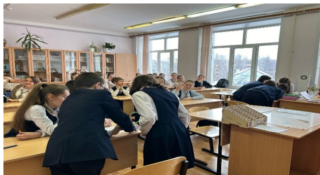
Интеллектуальная игра по русскому языку "АБВГДейка"