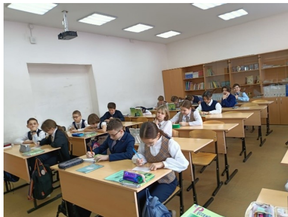
Лексический диктант в 5 Б классе