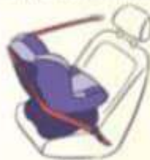
Лицом против движения