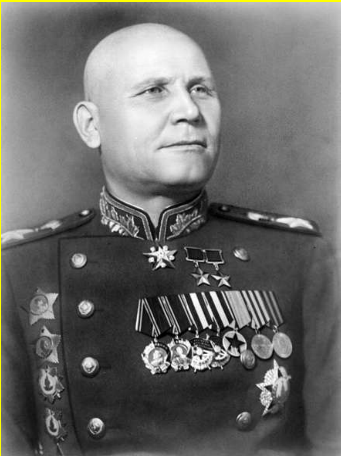
Конев Иван Никитич