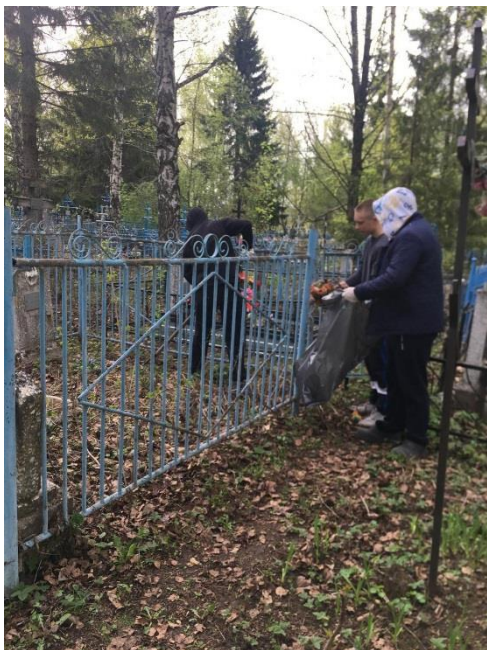
Волонтеры благоустраивает могилы