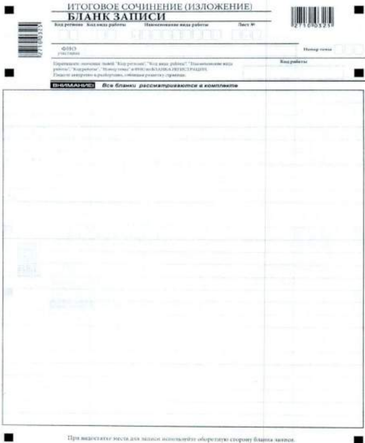
Рис. 5. Лицевая сторона двустороннего бланка записи