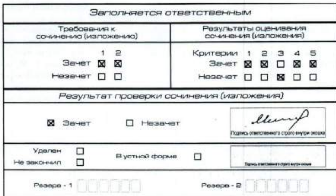
Рис. 8-10. Область для оценки работы

После окончания заполнения бланка регистрации ответственное лицо ставит свою подпись в специально отведенном для этого поле.