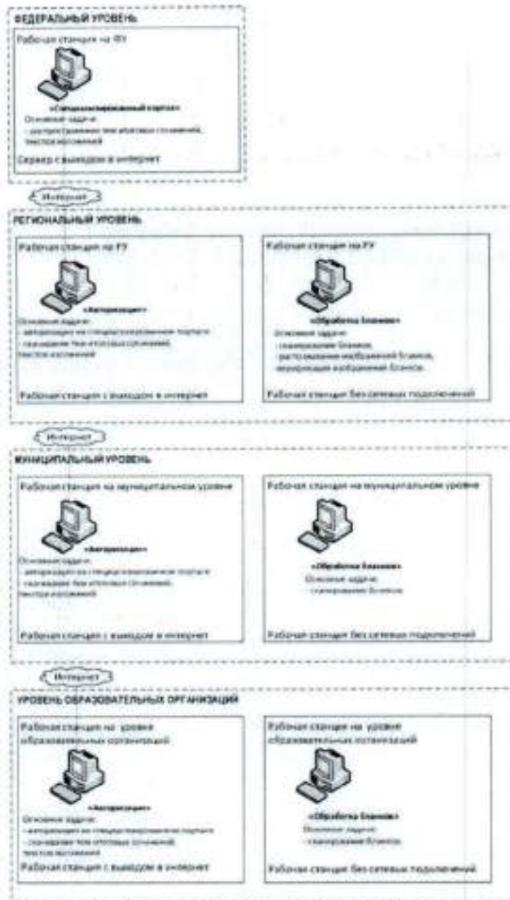
Рисунок 1. Архитектура и состав ПО

Схема ПО, используемого для проведения итогового сочинения (изложения), приведена на рисунке (см. Рисунок 1). На схеме приведены только новые или значительно модернизированные по сравнению со стандартной технологией проведения ЕГЭ модули и подсистемы.