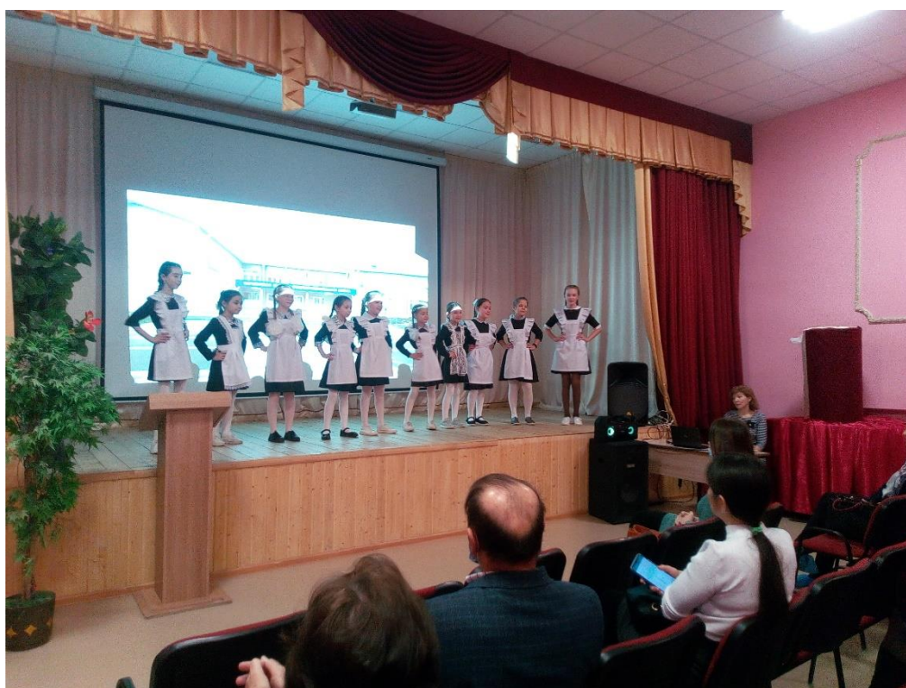
Рис.1 Открытие семинара.

Учащиеся школы принимали самое активное участие, познакомили участников семинара с оборудованием центра «Точка роста», продемонстрировали его работу.