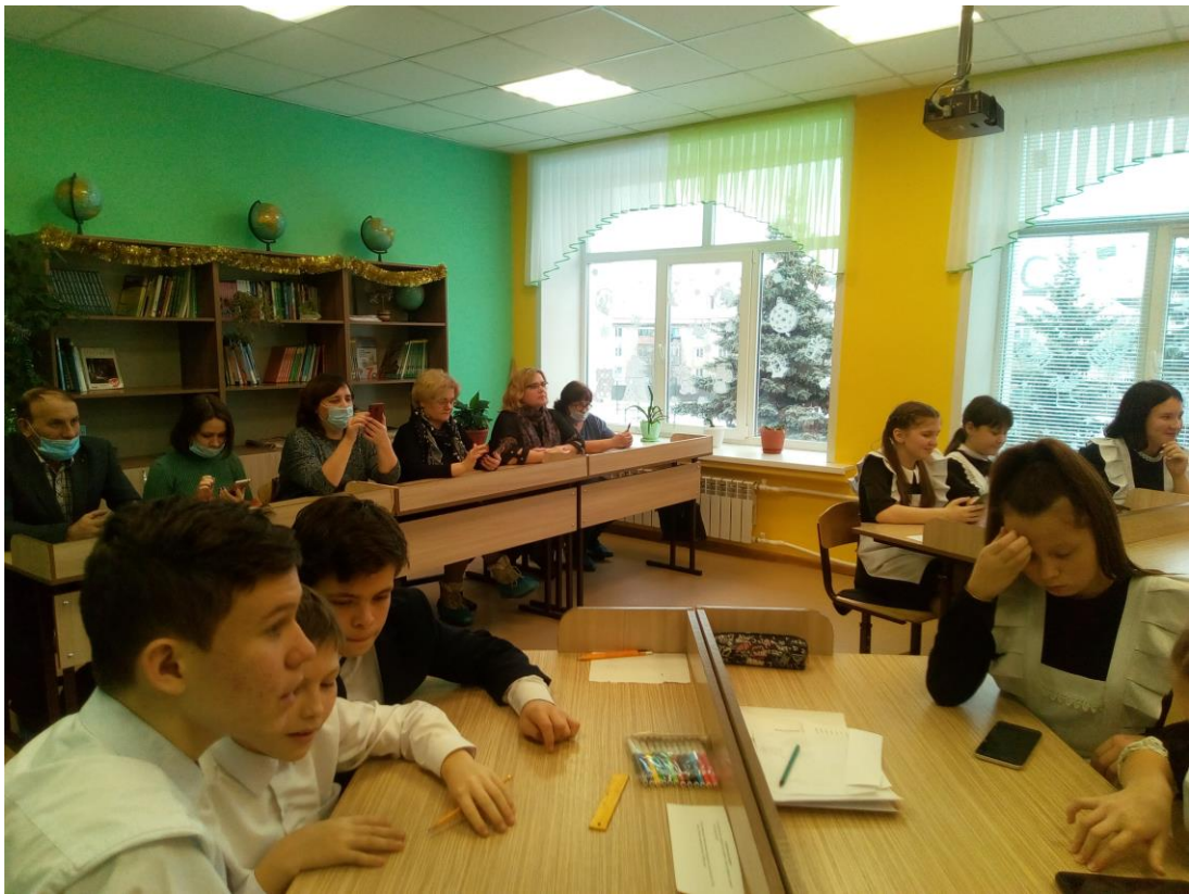
Рис.3 Внеурочное занятие