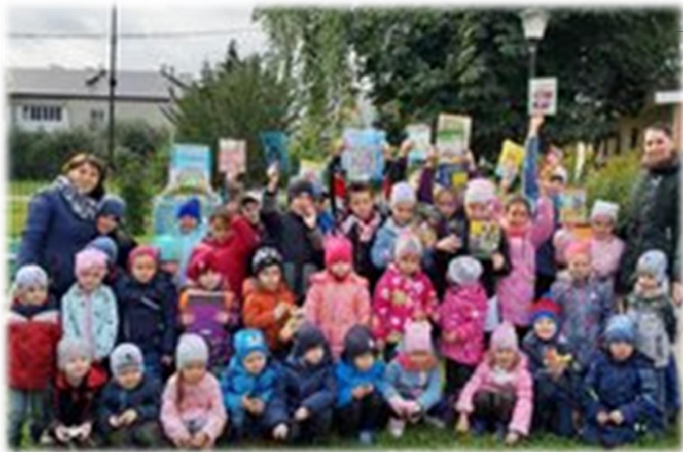
Акция "Олимп добра", За класс подарили книги воспитанникам детского сада