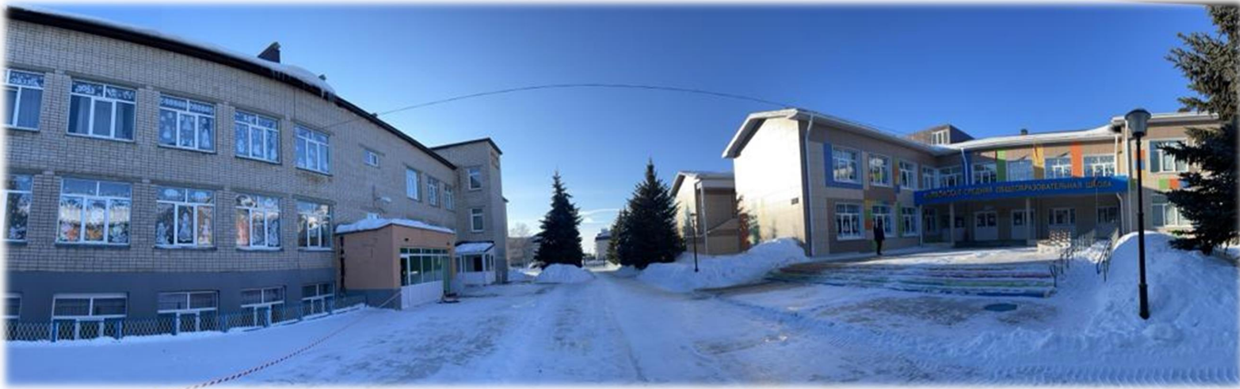
МБОУ «Нармонская СОШ