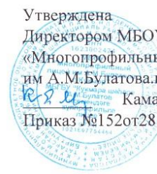
График занятости спортивных залов МБОУ «Многопрофильный лицей им.А.М.Булатова г.Кукмор» Кукморского муниципального района РТ 2023-2024 учебный год