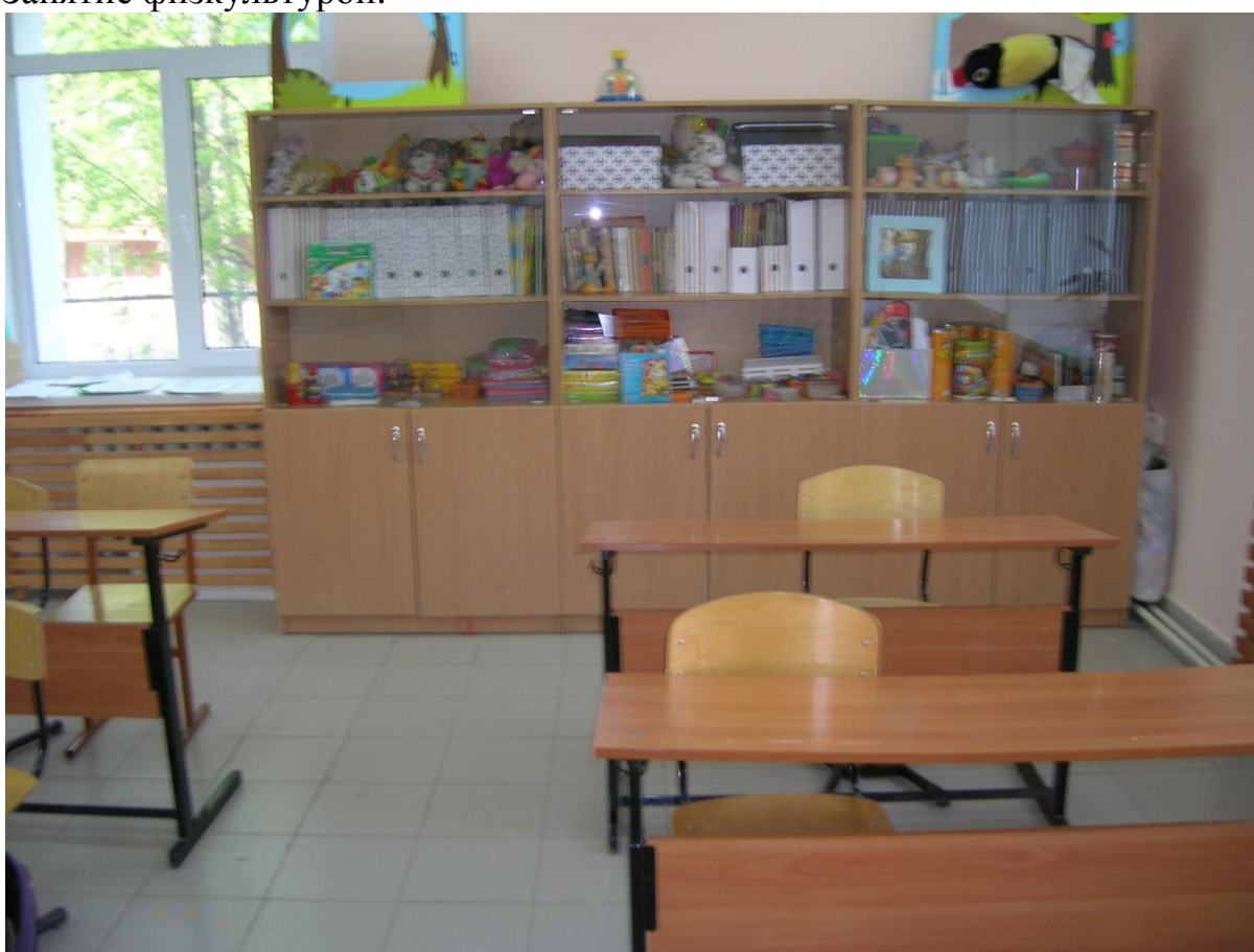
Кабинет для занятия с детьми с умеренной умственной отсталостью.