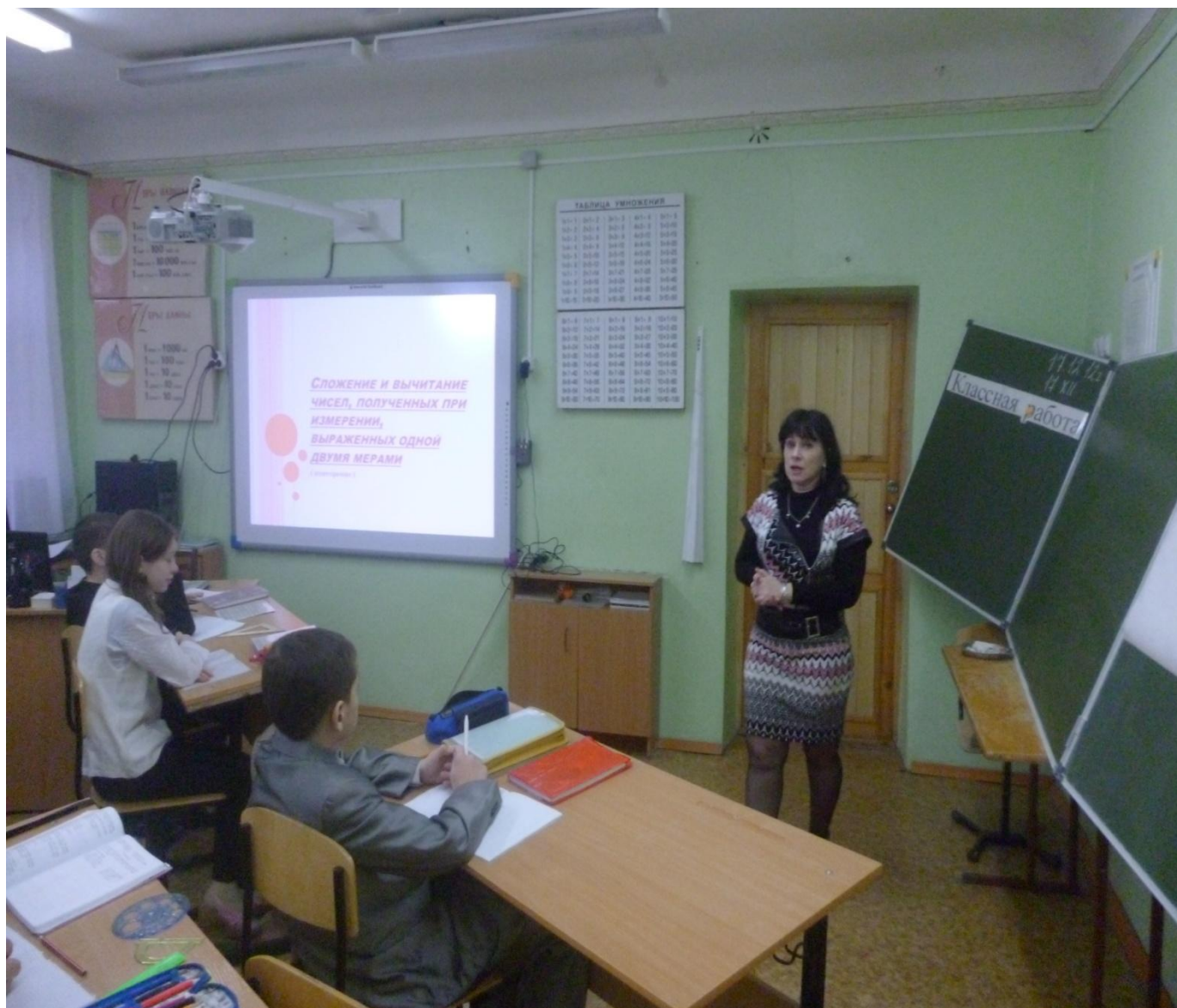
Урок математики в 7-А классе.

их гармоничного развития созданы оптимальные условия. Творческие студии, арттерапевтические программы (изо, музыка, театр, психология) помогают им раскрыть свой потенциал, раскрыть талант, расширить круг общения, развить кругозор.