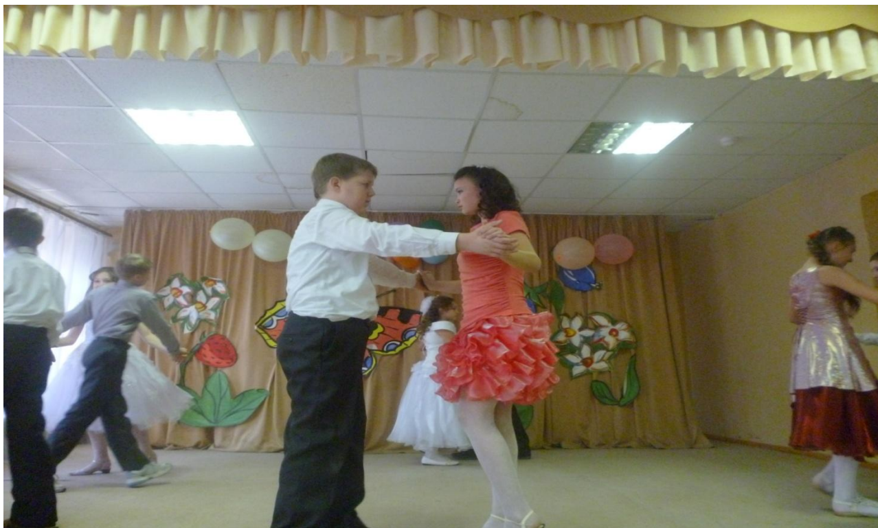
Общешкольное мероприятие. Праздничный концерт 8 марта