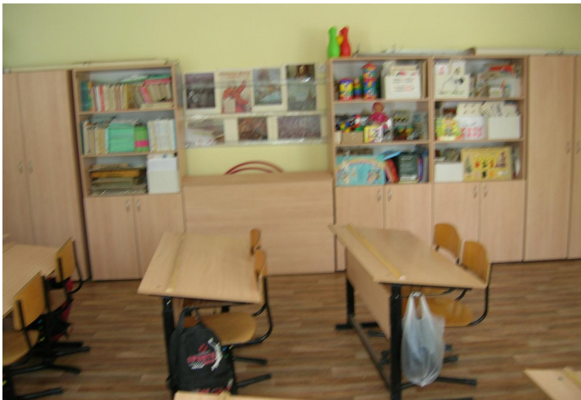
Кабинет начальной школы.