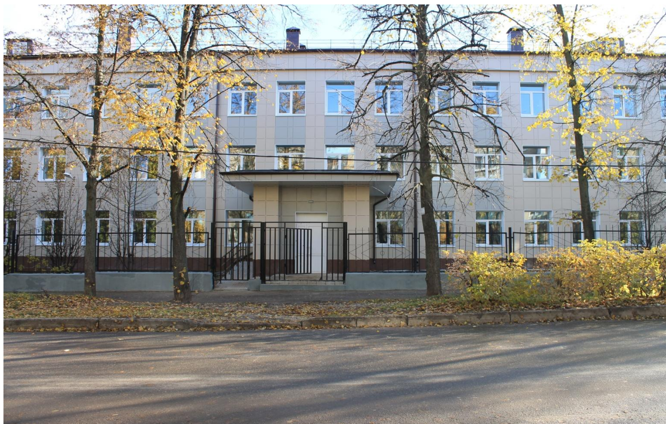
Наша школа после капитального ремонта (август ,2013)