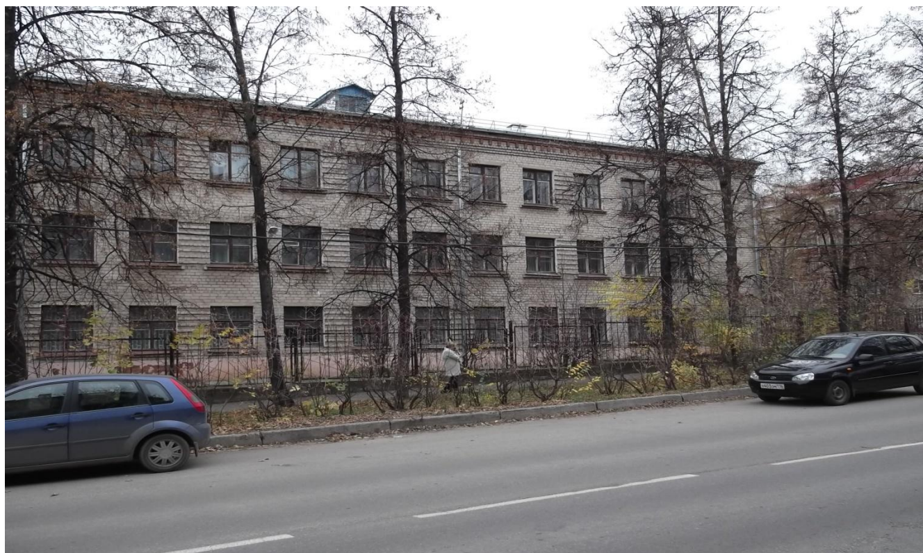
Школа с 1990 по 2013 год.